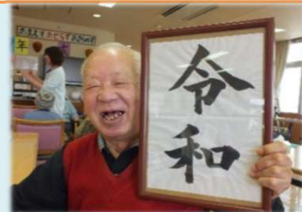
令和の笑顔ここにあり！