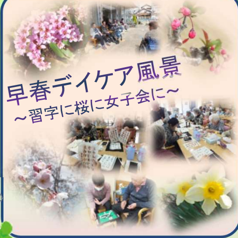
早春デイケア風景 ～習字に桜に女子会に～