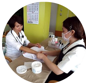
▲ハンドマッサージ

『パリ美容専門学校・千葉校』の協力のもと、生徒20名による「ハンドマッサージ、ネイル・ケア、ヘア・アレンジ」の無料体験イベントを開催しました。入院患者さまはじめ、たくさんの方に足を運んでいただき誠にありがとうございました。