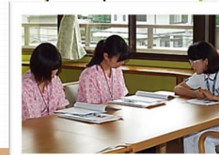
▲看護部長によるオリエンテーション