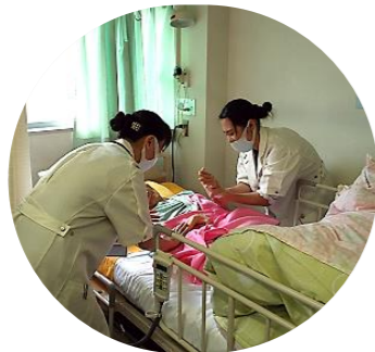
▲ベッドサイドでのハンドマッサージ