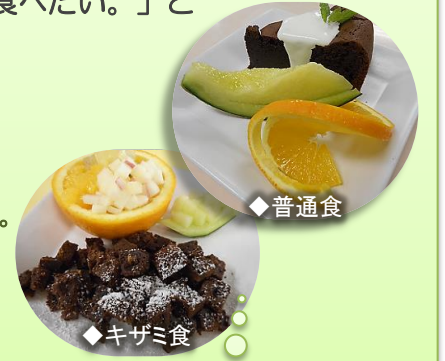
退院お祝い膳は、長谷川病院オリジナルです。患者さまに合わせて食べやすく。

『退院お祝い膳』は、患者さまおひとりお一人に合わせてお作りします。ご家族の方にも大変喜んでいただいております。