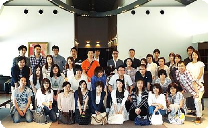
■施設内で野田病院のスタッフの方々を交えて集合写真

テルモの協力により、神奈川県足柄上郡にある総合医療トレーニング施設「テルモメディカルプラネックス」にて医療安全における接遇のスタッフ研修を行いました。 施設見学では、あまり目にする事のない医療機器や設備、また他病院の研修の様子も見せていただき、貴重な経験ができました。 今回の研修会には、野田病院のスタッフの方が参加し、情報交換などの交流が持てたりと例年以上の有意義な研修会となりました。