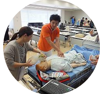
■Sim Man 3Gを用いた急変対策