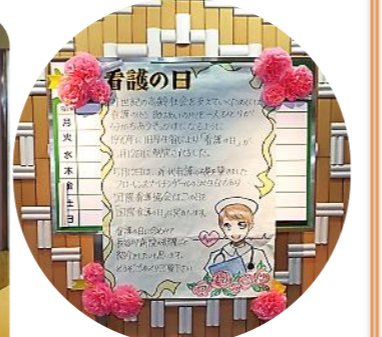
■『看護の日』は、ナースガールの誕生日です。