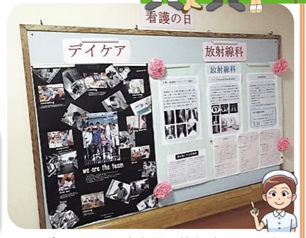
■ポスターには、各部署の特徴が出ています。

お知らせ 5月9日(月)～15日(日)の一週間、スタッフによる「手作りポスター」を展示していましたが、病院の様子をみなさまに広く知っていただきたく、展示期間を延長いたしました。診察の待ち時間や近くをお散歩の際にぜひ、お立ち寄りください。受付正面の通路にて展示しております。