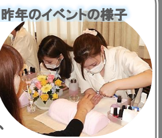
■昨年のイベントの様子

「無料」で体験ができます。千葉市にあるパリ美容専門学校の生徒さんによる「ハンドマッサージ」や「ネイルケア」、「ネイルアート」を体験しませんか？当日は、「地域のコミュニティスペース」として開放しますので、診療を受けない方も大歓迎です。足を運こんでいただき、美容のプロを目指す生徒さんの技術向上のため、ご参加いただければ幸いです。ぜひ、みなさんお誘い合わせでお越しください。