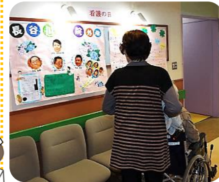
■外来待合室に展示。

お知らせ 5月9日(月)～15日(日)の一週間、スタッフによる「手作りポスター」を展示していましたが、病院の様子をみなさまに広く知っていただきたく、展示期間を延長いたしました。診察の待ち時間や近くをお散歩の際にぜひ、お立ち寄りください。受付正面の通路にて展示しております。