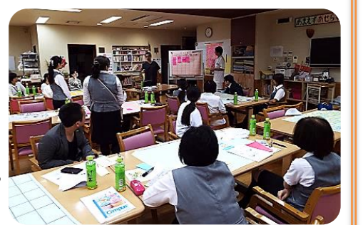
■研修の締めくくりは、グループ発表。

当院では、より良い病院づくりのため“インシデント・アクシデント”の報告がとても大切であると考えています。報告をもとに根本原因を追究し、医療の安全性を高めていきます。