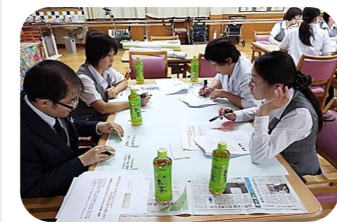
■今回は、事務職と薬剤科、臨床検査科、放射線科が合同で研修を行いました。